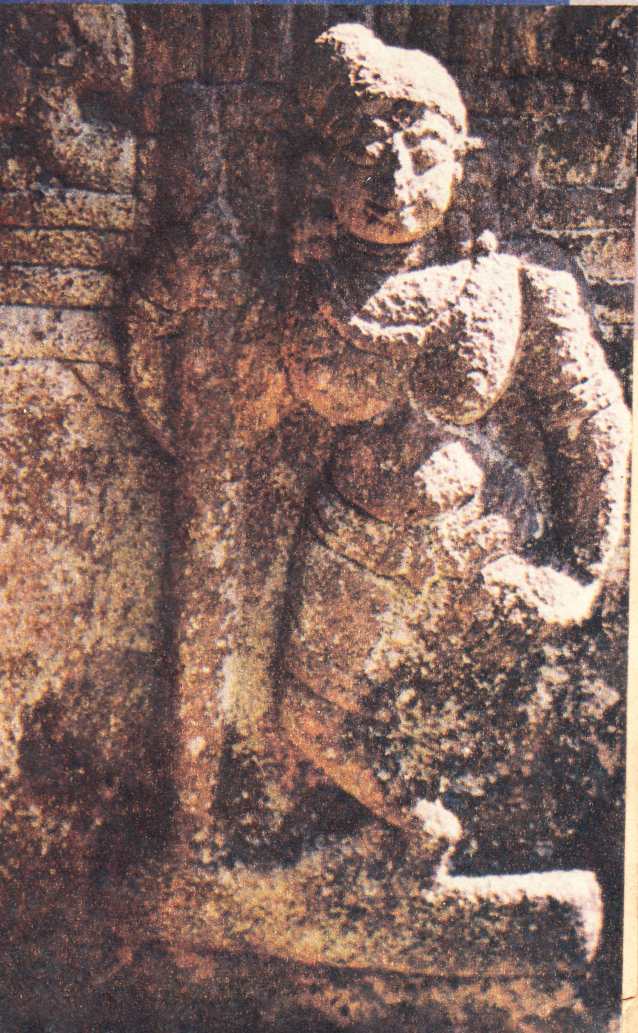
വയനാട്ടിലെ ജൈന ക്ഷേത്രത്തിൽനിന്ന്

എഴുത്തച്ഛന്റെ സമുദായത്തിന്റെ ബൗദ്ധ-ജൈന പാരമ്പര്യമാണ് എഴുത്തച്ഛൻ ഭഗവദ്ഗീതയെ വെറുതെ വിടാൻ തീരുമാനിച്ചത്. എഴുത്തച്ഛന്റെ ഭാരതവും രാമായണവും ഒരു പുനർവായനയ്ക്ക് നാം തയ്യാറാകണം. അതിനെ 'ബൗദ്ധായനം', 'ജൈനായനം' ആയി വായിക്കാൻ നമുക്ക് കഴിയണം.