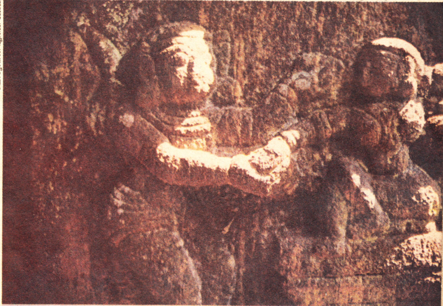
ഗീതയ്ക്കുപകരം എഴുത്തച്ഛൻ പലതരത്തിലുള്ള ലോകോക്തികൾ തന്റെ കൃതികളിൽ ചേർത്തിട്ടുണ്ട്. ഇതിൽ പലതും ഭഗവദ്ഗീതയ്ക്ക് വിപരീത ദിശയിലാണ്. വർണ്ണവ്യവസ്ഥയ്ക്കും ജാതിവ്യവസ്ഥയ്ക്കും എതിരായുള്ളതാണ് പല വരികളും.

തിവിപ്ലവ ശക്തികൾക്ക് മേൽകൈ ലഭിക്കുന്നത് ഈ സംഭവം മൂലമാണ്. ഇതിനുശേഷം എഴുതപ്പെട്ടതാണ് മനുസ്മൃതിയും ഭഗവദ്ഗീതയും. ഗീതയ്ക്കുമുൻപ് വേദങ്ങളിലെ കർമ്മകാണ്ഡ ഭാഗങ്ങൾക്ക് സൈദ്ധാന്തികതലത്തിൽ ഒരു സാധ്യകരണം ആരും നൽകിയിരുന്നില്ല. ബുദ്ധമതത്തിന്റെ വമ്പിച്ച വളർച്ചയാണ് അതിനുവഴിവെച്ചത്. പൂർവാപരവൈരുദ്ധ്യങ്ങൾ നിറഞ്ഞ ഒരു കൃതിയാണ് ഗീത. ആർക്കും അതിനെ എടുത്ത് ഉപയോഗിക്കാം. ആദിശങ്കരൻ അതിന് വ്യാഖ്യാനം ചമച്ചതോടുകൂടിയാ